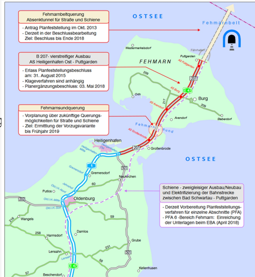
Grafik: Manuela Renk - VII 413